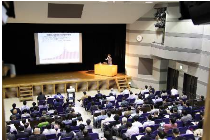
デイトタイムセッション