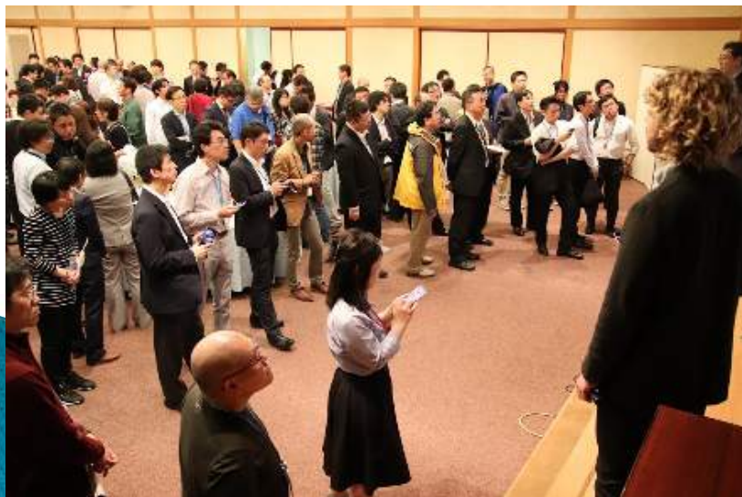
ナイトセッション